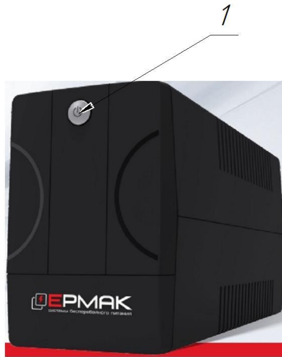
Рисунок 1.1 – Внешний вид изделия

1.4.2.3 Внешний вид задней части корпуса изделия в соответствии с рисунком 1.2.